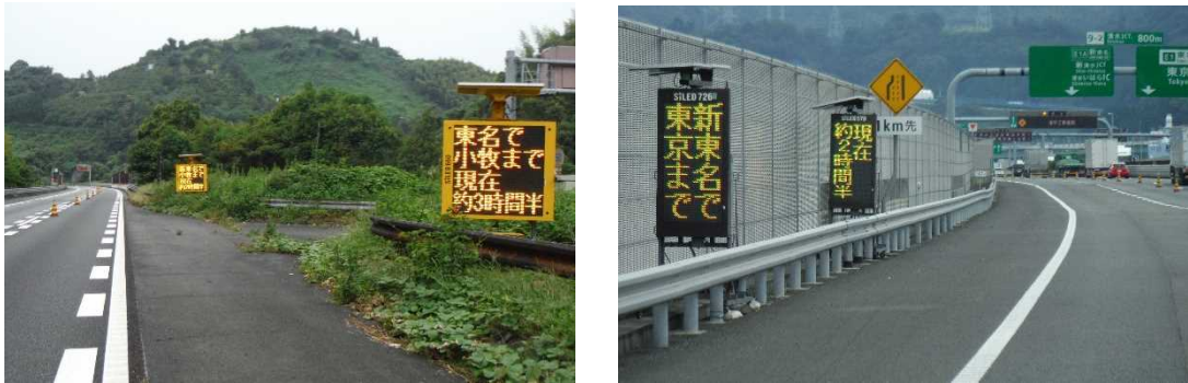
仮設LED情報板の設置状況

高速道路走行時の経路選択の参考となるように、E1東名と、迂回路となるE19・20中央自動車道、E1A新東名高速道路を經由した場合の所要時間を、東名の主要なJCT手前に設置した仮設のLED情報板で提供しました。